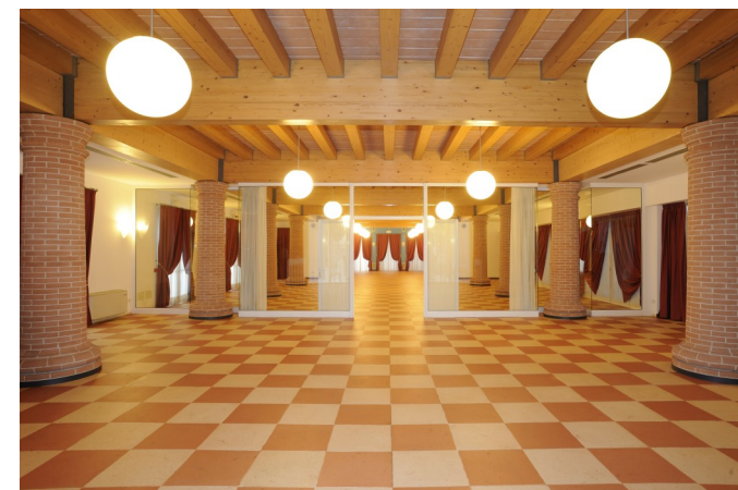
SALA DEGLI SCACCHI